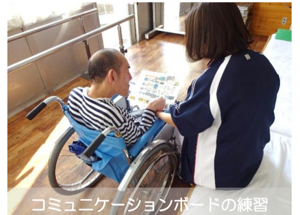
コミュニケーションボードの練習